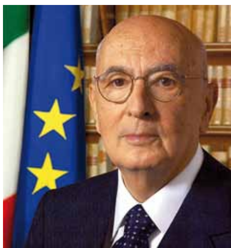
Fotografia ufficiale del Presidente della Repubblica Giorgio Napolitano

Rosella Benati, Presidente Com.It.Es. di Colonia